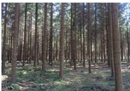
Рис. 3. Культуры ели европейской после проведения комплексного ухода (Гатчинское л-во, Орлинское уч. л-во, кв. 105, выд.14; 2016 г.)

[7]. Внесение азотных удобрений согласно рекомендациям [5] планируется через 2-3 года.