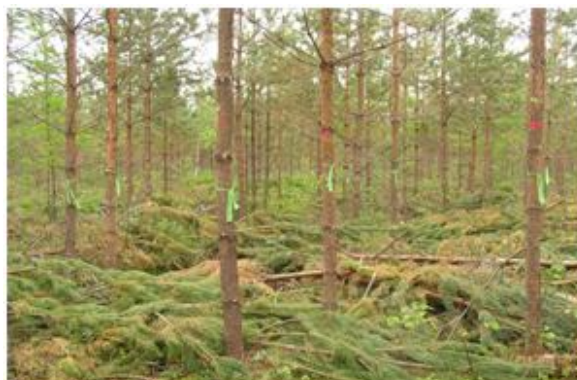
Рис. 1. Комплексный уход в сосновом молодняке. Выполнена прочистка и обрезка ветвей до 2 м Тихвинское л-во, Сясьское уч. л-во, кв. 34. 2010 г.

В данных экспериментах обрезка ветвей у сосны (рис. 1) проводилась с учетом существующих рекомендаций [8], согласно которым максимум биомассы хвои у деревьев 4-9 см ступеней толщины приходится на 4-ю мутовку. С помощью этого показателя биомасса хвои разделяется на две части: в верхней части кроны – световая хвоя, в нижней – теневая. Интенсивность фотосинтеза теневой хвои у сосны невелика, и часто даже не компенсируются расходы на дыхание. Наиболее продуктивны ветви в первые три года, затем продуктивность начинает резко падать. На основе этих критериев крона сосны делится на четыре естественные зоны: компенсационную (8-9-я мутовки), малопродуктивную (6-7-я мутовки), продуктивную (4-5-я мутовки) и ростовую (1-3-я мутовки и терминальный побег), на которые приходится соответственно 1-4, 18-28, 44-54 и 21-27 % продуктивной хвои. Исходя из этих данных, количество оставляемых мутовок у сосны равнялось 5-6 шт. [8].