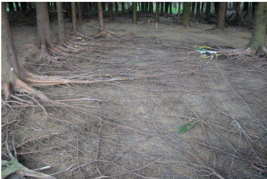
Рис. 2. Корневая система елового насаждения [6]

древостоев. Повышенную восприимчивость имеют корни, расположенные в верхнем слое почвогрунта глубиной до 0,20–0,25 м. Здесь расположена основная масса всасывающих корешков и корневых окончаний. Этот слой обладает лучшими физическими свойствами, содержит основное питание и обеспечивает достаточный подвод кислорода к корешкам за счет наличия пор. Особенно это касается еловых древостоев, корневая система которых расположена в данном горизонте (рис. 2).