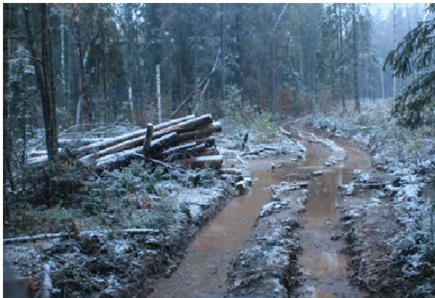
Рис. 1. Застой воды в углублениях колеи, образованной колесным форвардером при трелевке сортиментов

Уплотнение почвы в зоне колеи затрудняет процесс проникновения влаги в глубинные слои, способствует застою воды в углублениях или усиленному поверхностному стоку (рис. 1). Возникает опасность водной эрозии и трудности восстановления леса. Заметно изменяется мезорельеф лесной поверхности. На его нивелирование природой требуются многие годы.