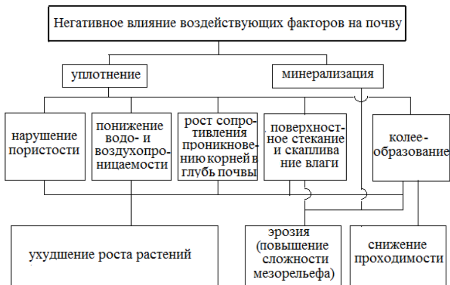
Рис. 4. Схема негативного влияния воздействующих факторов на почву и результаты их последствия

Сортиментная технология является наиболее перспективной для рубок ухода. Однако более половины таежной зоны Северо-Запада Российской Федерации расположено на лесных площадях с суглинистыми и глинистыми почвогрунтами повышенной влажности [8].