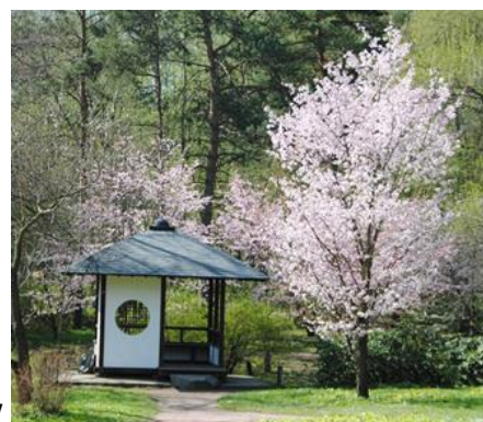
Рис. 7–8. Цветки сакуры Prunus sargentii Rehder (7) и цветение сакуры в японском саду ГБС РАН (8)

Воспетая в народных эпосах, старинных и современных песнях и танцах, изображаемая на свитках тушью, позолоченных раздвижных перегородках фусума и ширмах, в буддийских храмах и синтоистских святилищах, сакура стала символом целой страны, одним из тех слов, которые одинаково звучат на всех языках мира, подобно всем известным словам «самурай», «сумо» или «икебана».