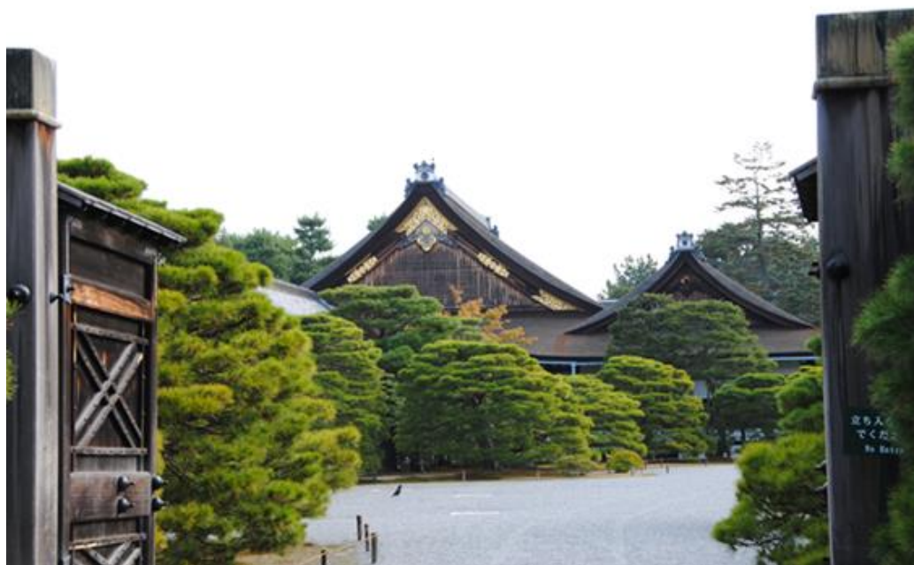
Рис. 1. Сосны в саду императорского дворца, Киото