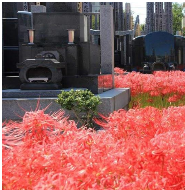
Рис. 4. Ликорис лучистый на японском кладбище

ассоциируется со смертью через целый ряд народных названий: сибито-бана – «цветок умерших», дзигоку-бана – «адский цветок», юрэй-бана – «цветок призраков» (Ерышов, 2018). Использование ликорисов на кладбищах обосновано и чисто практически: его ядовитые луковицы не повреждают мыши, поэтому яркое цветение, преподносимое духам предков, гарантировано.