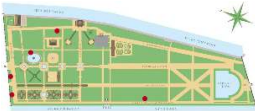
Рис. 4. Схема Летнего Сада с расположением устройств Tree Talker