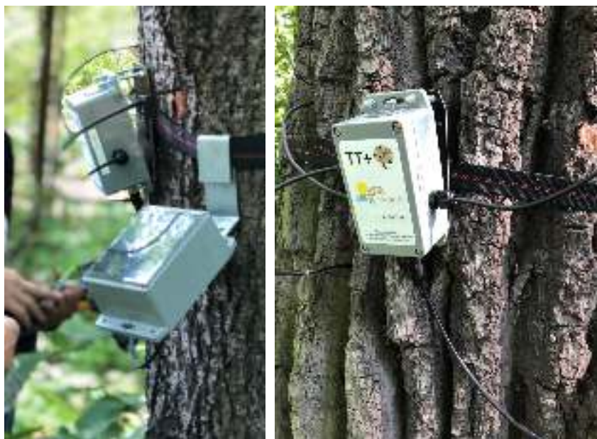
Рис. 1. Устройства мониторинга Tree Talker, установленные на стволе дерева в Ботаническом саду СПбГЛТУ (слева) и Летнем саду (справа)

Fig. 1. Tree Talker monitoring devices installed on a tree trunk in the Botanical Garden of St. Petersburg State Forest Technical University (left) and the Summer Garden (right)