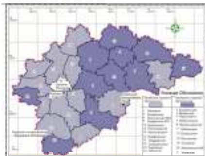
Рис. 3. Характеристика лесничеств по степени горимости