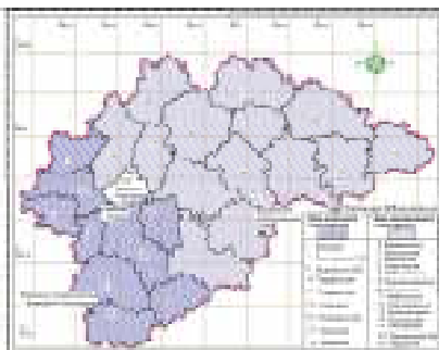
Рис. 4. Карта-схема распределения земель лесного фонда Новгородской области по зонам мониторинга