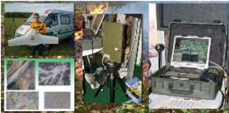
Рис. 5. Применение беспилотных летательных аппаратов (БПЛА) для охраны и защиты лесов

Мониторинг пожарной опасности в лесах и лесных пожаров включает в себя наблюдение и контроль за пожарной опасностью в лесах и лесными пожарами; организацию системы обнаружения и учёта лесных пожаров, системы наблюдения за их развитием с использованием наземных (рис. 3), авиационных или космических средств; организацию патрулирования лесов; приём и учёт сообщений о лесных пожарах, а также оповещение населения и противопожарных служб о пожарной опасности в лесах и лесных пожарах специализированными диспетчерскими службами.