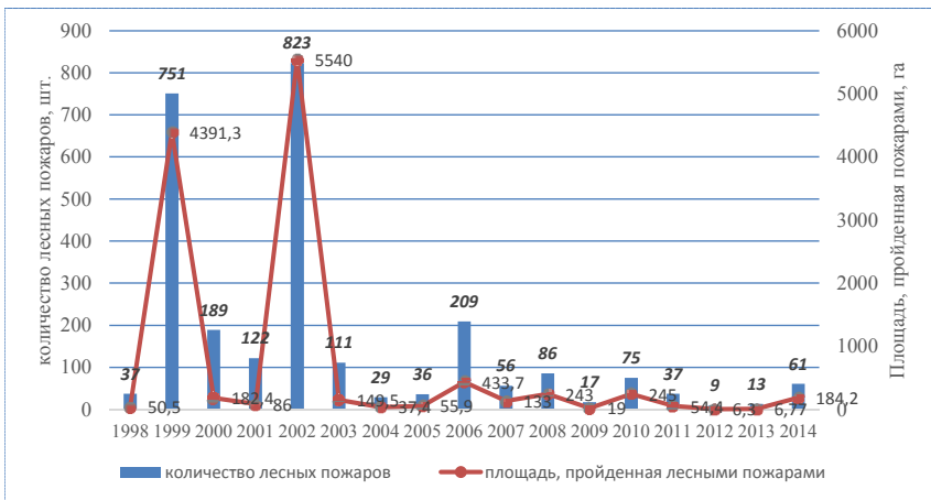
Рис. 2. Динамика лесных пожаров в Новгородской области 1998–2014 гг.

Сведения о динамике фактической горимости лесов приведены на рис. 2. Анализ данных за более продолжительный период показывает сильную изменчивость данного показателя. Результаты учета лесных пожаров за период с 1989 по 1994 гг. показали, что среднегодовое количество пожаров на территории области составило 81, а за более ранний период с 1969 по 1997 гг. их численность превысилась в 1,5 раза – 117. Динамика горимости связана с особенностями погоды лесов в разные годы (Лесной план Новгородской области, 2018). Лесные пожары в слабогоримые годы возникали в мае – июле, а в августе наибольшее количество пожаров возникало в годы с продолжительной засушливой погодой весной и летом, когда леса отличались крайней опасностью в пожарном отношении. Средняя площадь, пройденная пожарами за сезон на территории области, варьируется от 6,3 до 5540 га.