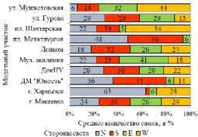
Рис. 2. Характер распределения Physokermes piceae по экспозициям кроны Picea pungens Engelm. в степной зоне Украины в 2020 г.

Распространение в регионе и вредоносность. В пределах всего ареала P. piceae является опасным вредителем как естественных еловых лесов, так и декоративных насаждений, которые, по мнению специалистов, поражаются интенсивнее [Graoga et al., 2012; Holsten et al., 2008; Борхсениус, 1957; Терезникова, 1981; Marčiulynas, 2016]. Вредоносность большой еловой ложнощитовки заключается в высасывании самками и личинками сока побегов и хвои, в результате чего опадает хвоя, уменьшается годовой прирост побегов, происходит их искривление [Борхсениус, 1957; Wallner, 1978; Gedminas et al., 2015; Graoga et al., 2012; Miežite et al., 2013; Marčiulynas, 2016]. Медование P. piceae способствует заселению елей комплексом сапрофитных грибов, вызывающих снижение транспирации и фотосинтеза [Miežite et al., 2013].