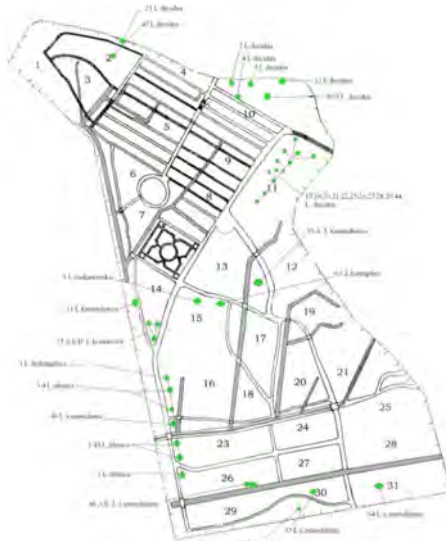
Рис. 1. Схема произрастания Larix в Нижнем дендросаду на 2018 г. Fig. 1. Larix growth scheme in the Lower Arboretum for 2018