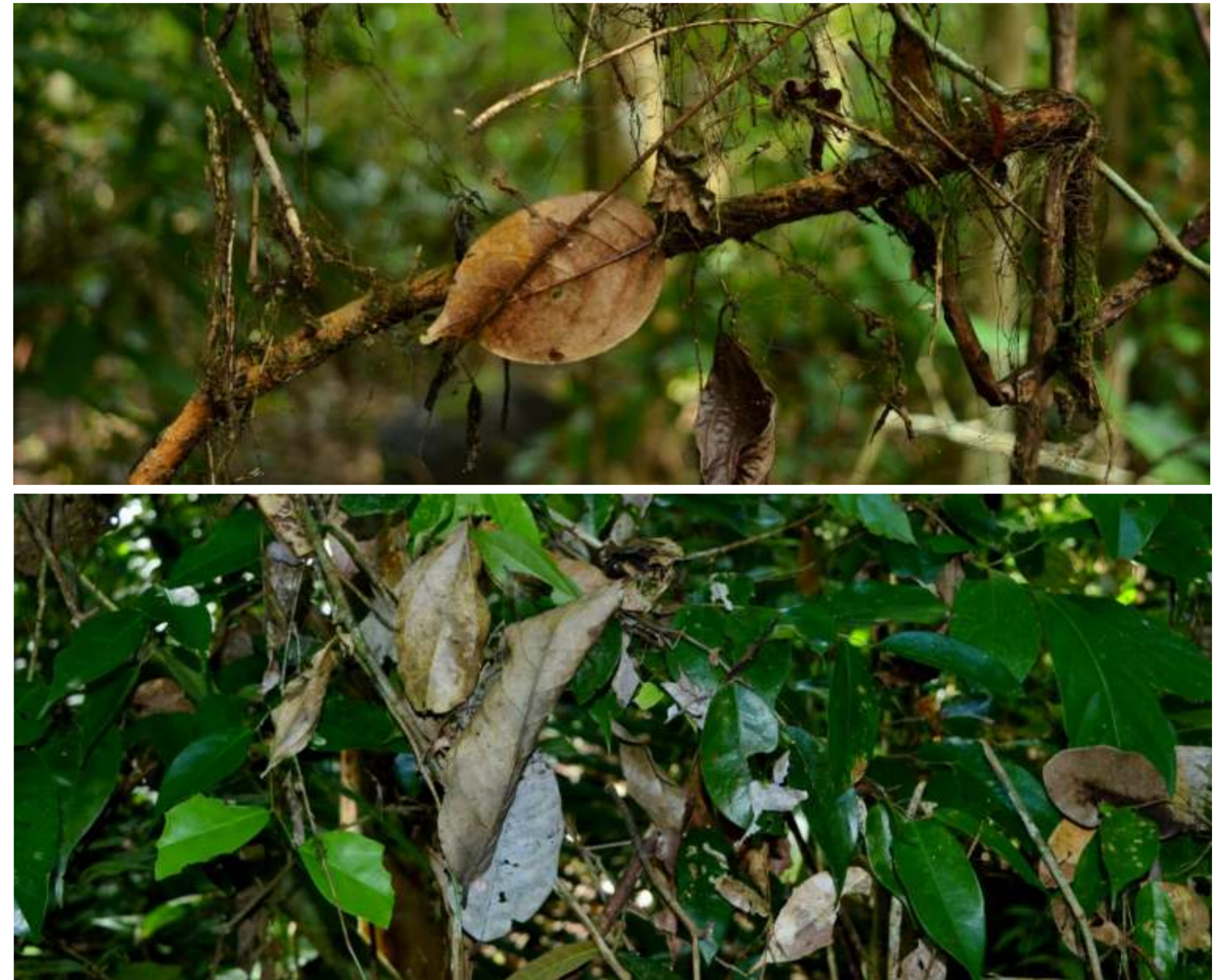
Растительный опад, удерживаемый ризоморфами маразмиоидных грибов (род Marasmius ). Так называемый «подвешенный» опад

Материал «подвешенного» опада собран в муссонном тропическом лесу национального парка Донг Най (Южный Вьетнам) в сотрудничестве с Российско-Вьетнамским тропическим научным центром в ноябре-декабре 2016 г. Беспозвоночных экстрагировали из опада на эклекторах Тульгрена. Определение «изотопных» трофических ниш беспозвоночных проведено методом изотопного анализа (стабильные изотопы углерода \delta^{13}\text{C} и азота \delta^{15}\text{N} ).