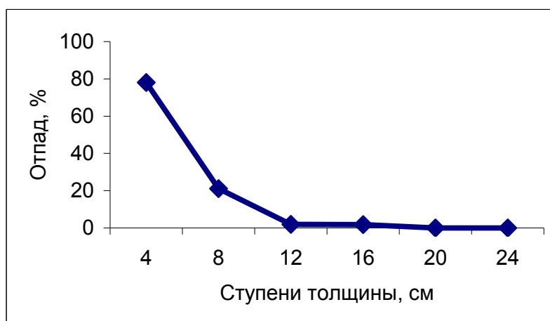
Рис. 2. Зависимость процента отпада от диаметра древостоя

б) Постройте графики зависимости процента отпада от диаметра древостоя (пример показан на рис. 2) через 10, 20 и 30 лет после начала наблюдения. Установите закономерности и дайте объяснения.