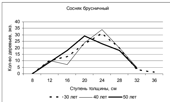
Рис. 1. Ряды распределения деревьев по ступеням толщины в 30, 40 и 50 лет

б) Определите и сравните между собой статистические показатели рядов распределения в начале и в конце периода наблюдений по форме табл. 16. Объясните изменение этих показателей.