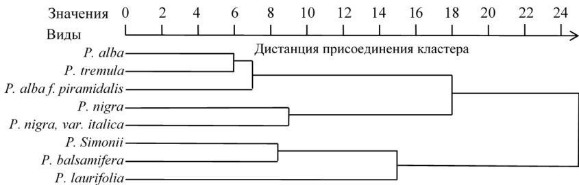
Рис. 2. Дендрограмма сходства тополей по содержанию и балансу запасных веществ

стер объединил таксономически близкие виды: типичную форму тополя белого, осину, тополь белый пирамидальный. Их агломерация началась на уровне 6,02 единицы масштаба 25-разрядной шкалы и завершается порогом 7,03 единицы. Следующим самостоятельным кластером можно признать группировку двух видов из секции черных тополей: тополя черного и тополя итальянского. Порог слияния составил 8,90, а слияние с предыдущим кластером осуществилось на достаточно отдаленной границе – 17,90 единицы. Третий кластер, как и первый, состоит из трех многомерных объектов, представленных только бальзамическими тополями: тополем китайским, или Симони, тополем бальзамическим и тополем лавролистным.