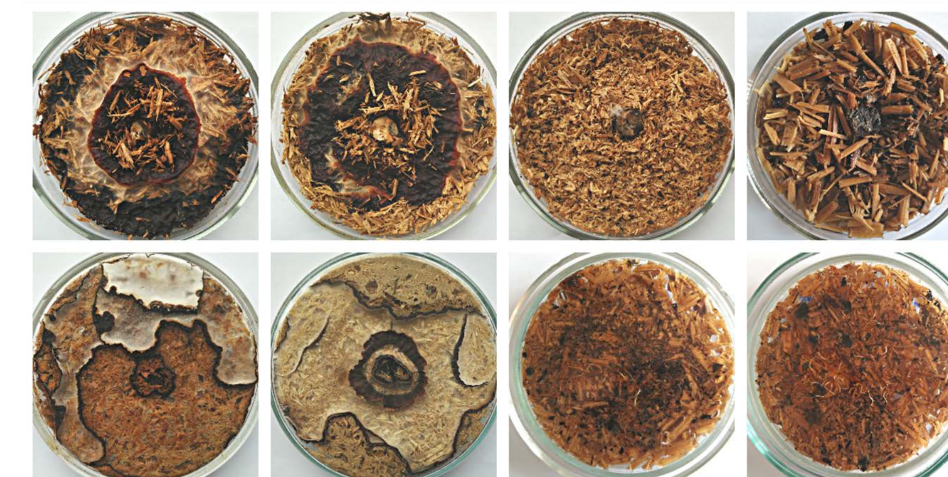
Рис. 4 – Твердофазное культивирование A. borealis на растительных субстратах

В древесине пихты сибирской на долю лигно-углеводной составляющей приходится 92,5% от общего количества абсолютно сухого субстрата; сумма полисахаридов составляет 59,4%; негидролизуемый остаток, включая лигниновые вещества – 33,1%. При твердофазной ферментации древесины (рис. 4) отмечена различная, но достаточно высокая дереворазрушающая активность всех исследуемых штаммов A. borealis . Убыль массы субстрата составила 8–13%. Отмечена общая тенденция снижения количества полисахаридов (в 1,3–1,5 раза), преимущественно за счёт ферментализации трудногидролизуемой фракции на фоне уменьшения концентрации лигниновых веществ в 1,2–1,3 раза по сравнению с исходным субстратом.