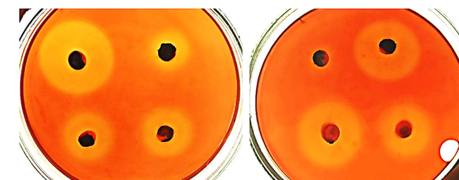
Рис. 3 – Целлюлазный экспресс-тест

Максимальные значения индекса целлюлазной активности (5–6 ед.) отмечены у 37% штаммов (рис. 3).