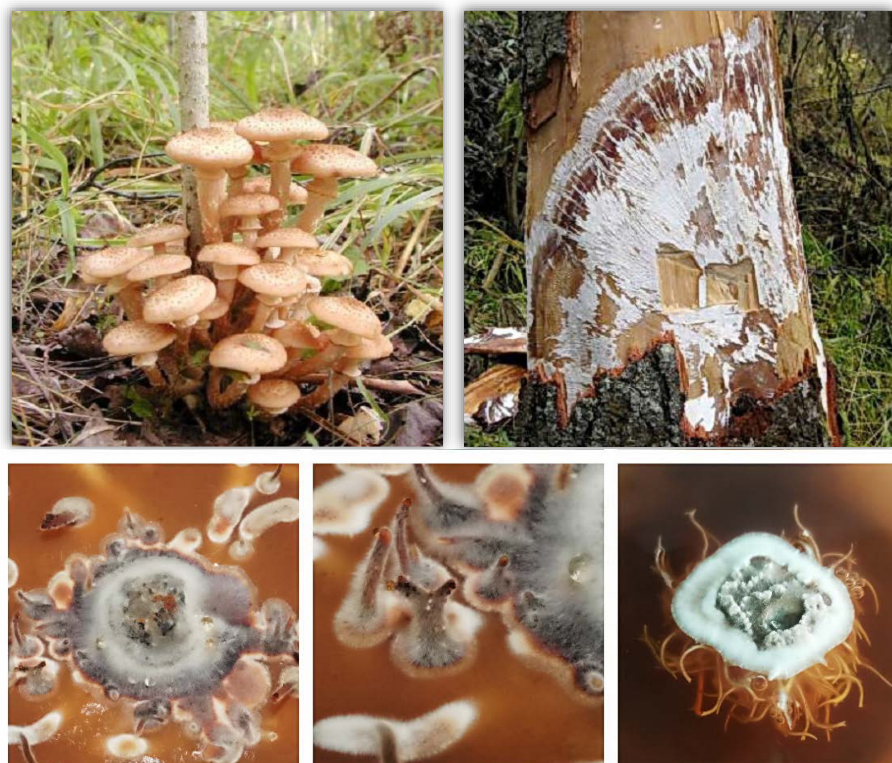
Рис. 1 – Плодовые тела A. borealis (слева сверху), веер мицелия под корой дерева (справа сверху), морфология колонии in vitro (внизу).

Дереворазрушающие свойства A. borealis обусловлены, в первую очередь, синтезом комплекса гидролитических и окислительно-восстановительных ферментов. При появлении первых симптомов поражения (дехромация хвои, истечение смолы) следует ожидать достаточно быстрое усыхание дерева.